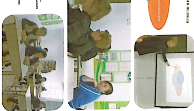
Образование в контексте сферной геометрии