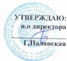
ГРАФИК ДЕЖУРСТВА администрации школы в столовой КГУ "Общеобразовательная школа № 28" на II полугодие 2022-2023 учебного года