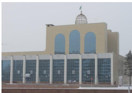
6, 7, 8, 9 қабатты (30 метрге дейін) ғимараттарда

фронтоньында немесе ғимаратқа кіреберіс мандайшада орналастырылады - 2, 3, 4, 5 қабатты (20 метрге дейін) ғимараттарда Қазақстан Республикасының Мемлекеттік Елтаңбасы соңғы қабаттың жабу деңгейінде немесе фронтоньында (диаметрі 1-ден 1,5 метрге дейін) немесе ғимаратқа кіреберіс мандайшада (диаметрі 500 миллиметр) орналастырылады