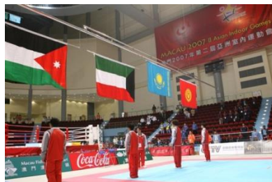
Қазақстан Республикасының спорт-шысы жеңімпаз болған кезде

Жарыстардың ашылу және жабылу кезіндегі Тумен өткізілетін салтанатты шеру