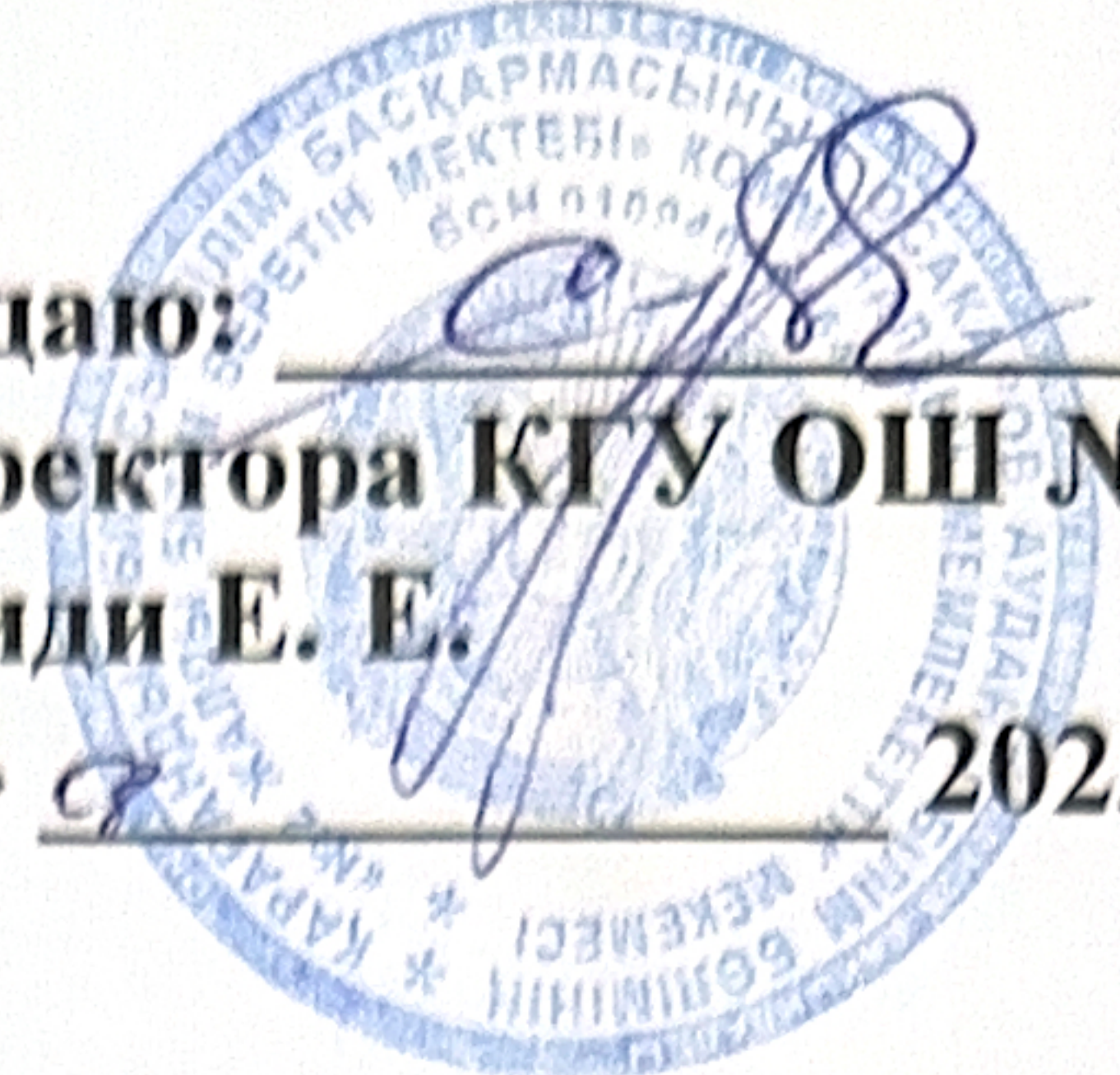
ГРАФИК Работы школьной комиссии по мониторингу за качеством питания КГУ «Общеобразовательная школа №2» отдела образования Осакаровского района управления образования Карагандинской области на 2023 – 2024 учебный год