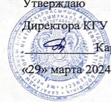
ГРАФИК ПРОВЕДЕНИЯ КОНСУЛЬТАЦИЙ В 9 КЛАССЕ.