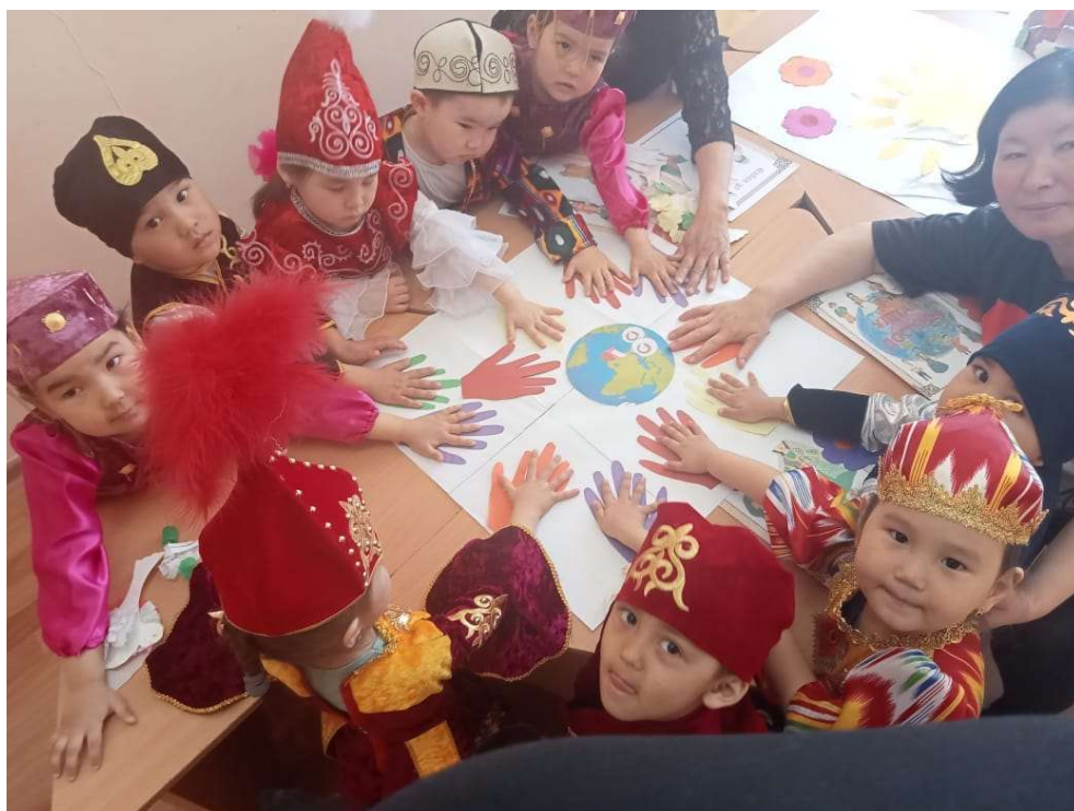
Толық күнгі «Шұғыла» шағын орталығының «Туған – өлкем тұғырым» апталығы