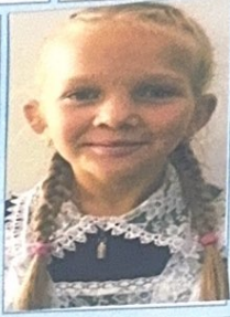
фото 9-11(12) сынып 9-11(12) кл.