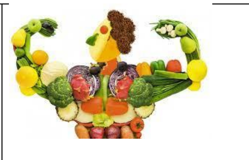
2 - ұйымдастырылған іс-әрекет